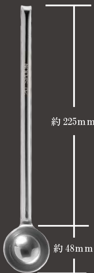
全長約 273mm ツボ部分 外径約 45Φ