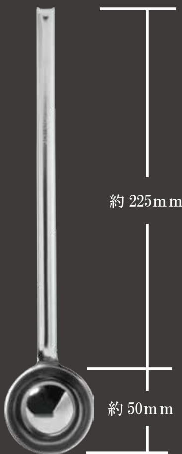
全長約 275mm ツボ部分 外径約 52Φ