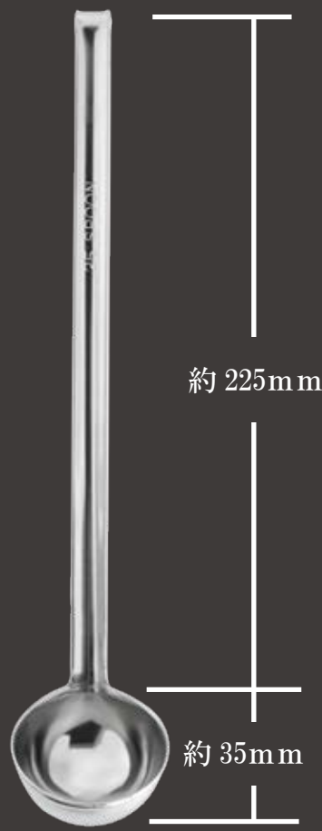
全長約 260mm ツボ部分 外径約 47Φ