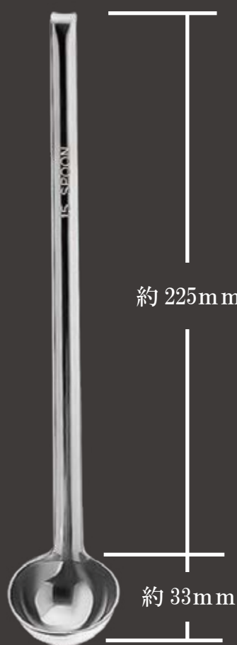
全長約 258mm ツボ部分 外径約 42Φ