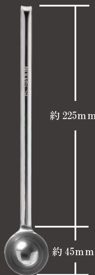
全長約 270mm ツボ部分 外径約 42Φ