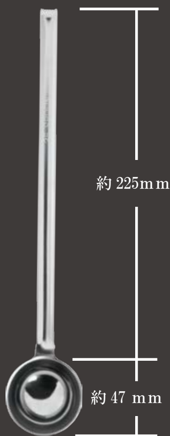
全長約 272mm ツボ部分 外径約 47Φ