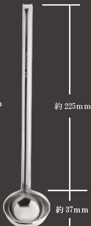
全長約 262mm ツボ部分 外径約 52Φ